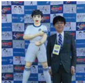
29年1月、2回目の開催となる「キャプテン翼CUP葛飾」の開会式に出席。