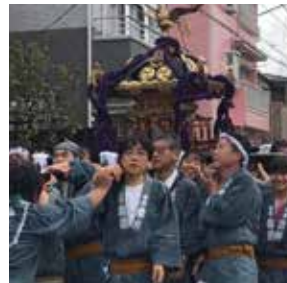
29年10月、今年も地元の祭りに参加!