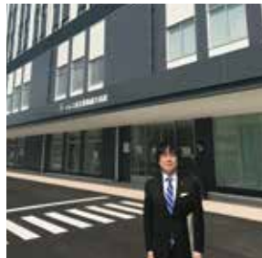
29年4月、区が南部拠点病院として新小岩に誘致したイムス東京葛飾総合病院へ。