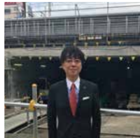
29年9月、新小岩駅南北自由通路を視察。30年夏頃暫く使用開始、31年完成予定。