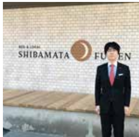
29年3月、葛飾区の旧柴又職員寮を民間に貸与した宿泊施設を見学。