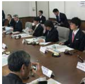
29年5月、文教委員会で鹿児島県始良市を視察。